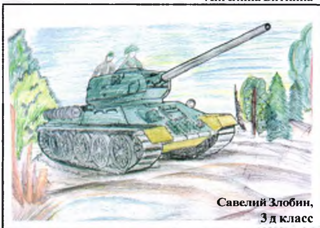
Савелий Злобин, 3 д класс