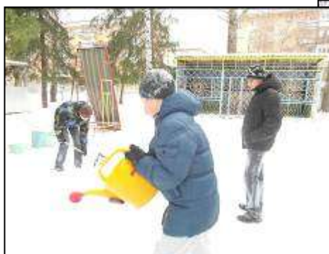
7 «г» класс делает горку в садике №39.

В начале декабря в нашей школе прошла акция "10 000 добрых дел". В ней приняли участие целых 35 классов! Каждый внёс свой посильный вклад. Первоклашки ухаживали за цветами. Старшеклассники помогали пожилым людям: оказывали помощь в уборке квартиры, собирали тёплые вещи, украшали к праздникам залы благотворительных организаций. Наши ребята побывали в детских садах, в Доме ребёнка, в Центрах социальной помощи. Акция показала, что в нашей школе учатся добрые, отзывчивые, неравнодушные к чужим проблемам дети! О них – наш фоторепортаж.