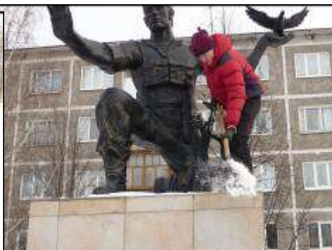
10 «в» класс благоустраивает городской памятник..