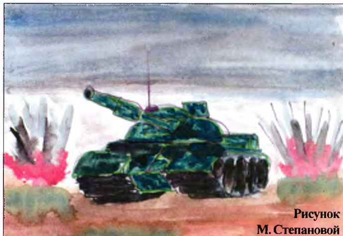
Рисунок М. Степановой

Едет танк по белу полю. Видит танк – в засаде враг. Враг открыл огонь по танку, Танк взорвался, вот беда... ... Но отважная пехота уничтожила врага.