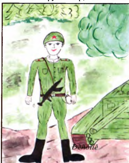
Рисунок А. Сахибулина

Учредитель и издатель: МАОУ «СОШ №3». Адрес: 623281, Россия, Свердловская область, п. Ревда, ул. Российская, 44, пресс-центр (каб. № 310)