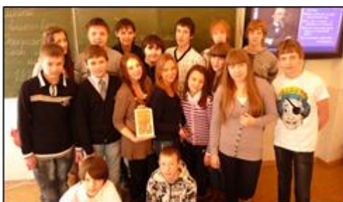
Некрасовские чтения в 8 г классе.

Учителя очень порадовала наша подготовка и ответственность. Ребята 6 "г" поработали на славу! Было очень интересно!»