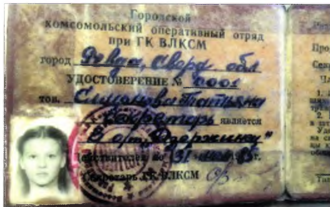
Отряд «Держинец», командиром которого одно время был Игорь Ржавитин (на первом фото справа), следил за общественным порядком. Здесь члены отряда проверяют неблагополучную квартиру. Тогда у каждого из них было специальное удостоверение, как на втором фото.