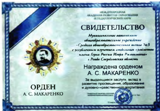
Орден А.С.Макаренко — высшая национальная награда общественного признания заслуг и достижений в просветительской, преподавательской и образовательной сфере. И в этом году его получила школа №3.