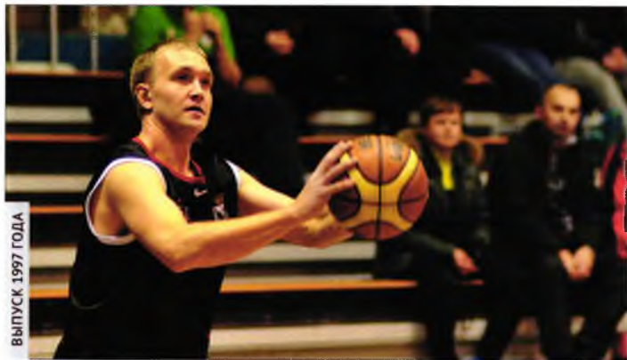
ВЫПУСК 1997 ГОДА